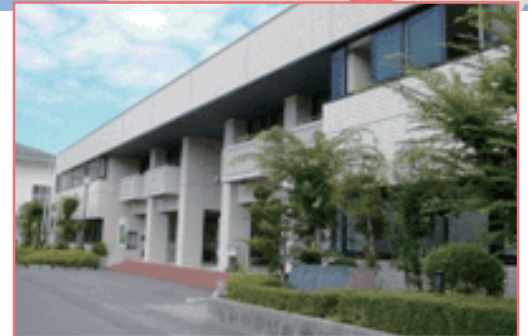
八百津町ファミリーセンター 大ホール